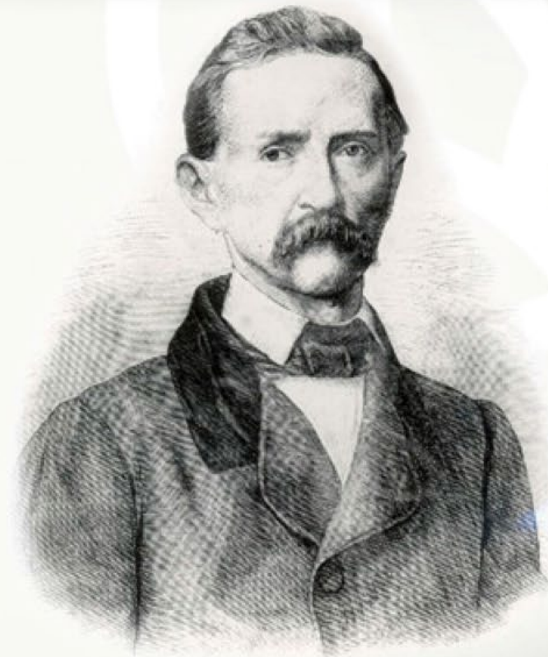
Patron Ośrodka – Hipolit Cegielski